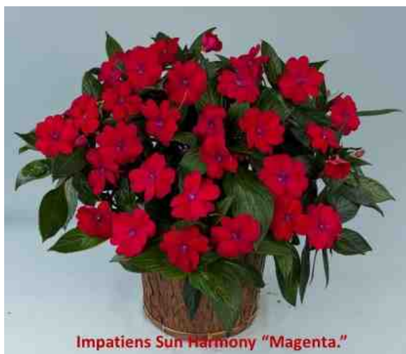
Impatiens Sun Harmony "Magenta."

"Magenta" behoort tot de groep van de Nieuw Guinea impatiens en heeft vrij grote rode bloemen en een compacte groei. Dit is een van de Vlijtige Liesjes die in de schaduw en in de zon geplant kan worden. De mooie rode bloemen steken af tegen de donker groene bladeren. Ze is zeer geschikt als perkplant, maar kan ook met planten in een pot gecombineerd worden. Let er wel op dat de gecombineerde planten dezelfde hoeveelheid water lusten. Door zijn compacte groei is ze uitstekend geschikt als opvulling in combinatie met andere planten. Kan echter niet tegen een constant natte wortelkluit en tegen het van boven water geven door het midden van de plant.