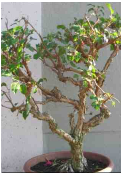
De uitlopers worden enkele malen terug geknipt tot op twee bladparen om een bossiger plant te vormen.