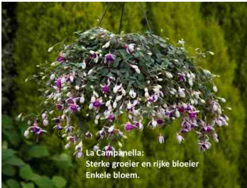
La Campanella: Sterke groeier en rijke bloeier Enkele bloem.

Fuchsia La Campanella is een hanger en de scheuten waaraan de bellen hangen kunnen wel 40 centimeter lang zijn. De bloemen zijn roodpaars en de bloeitijd is van juni tot en met oktober. La Campanella kan wel wat zon verdragen, maar geeft de voorkeur aan de halfschaduw.