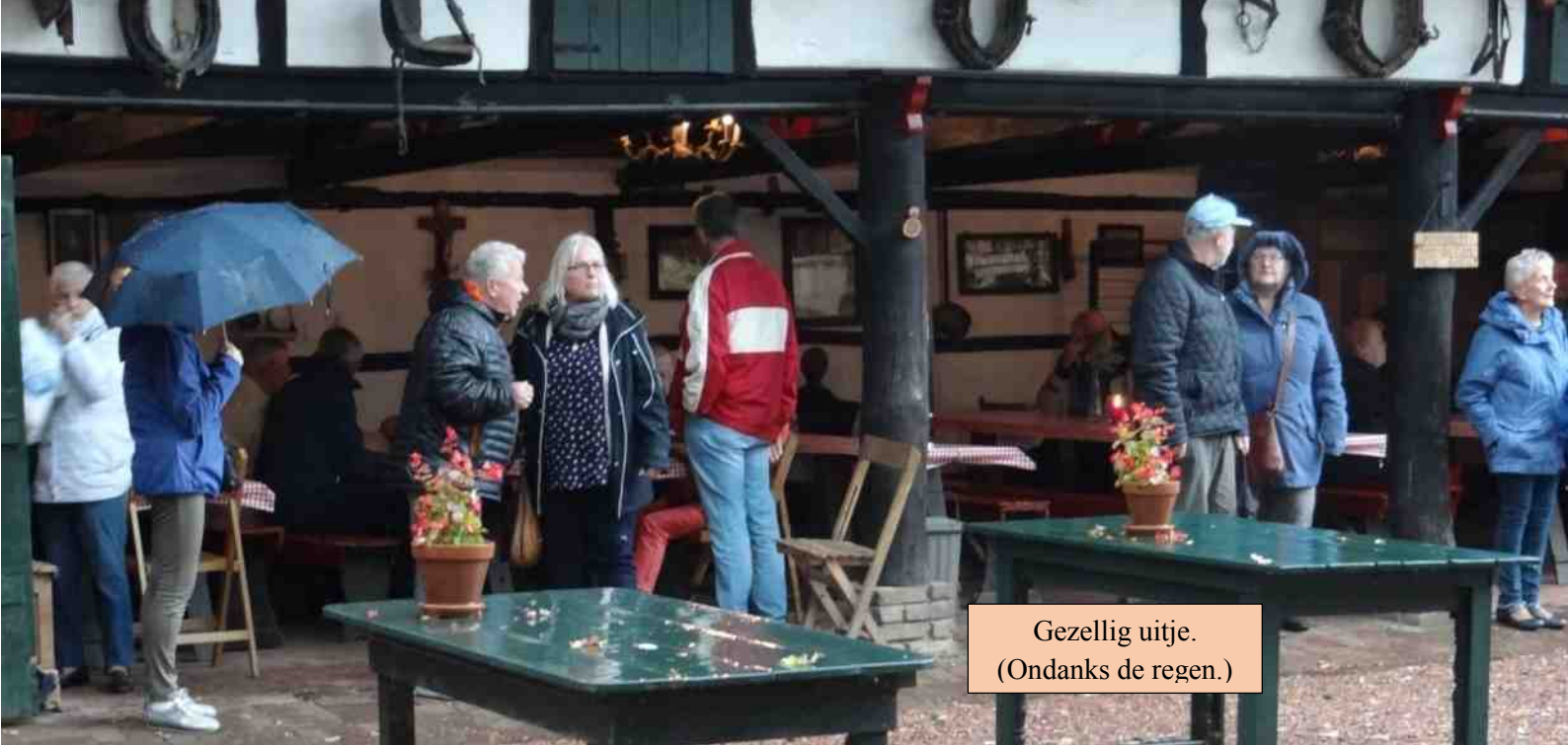
Gezellig uitje. (Ondanks de regen.)

bezoekt, met vooral aandacht over de nieuwe AVG wet.