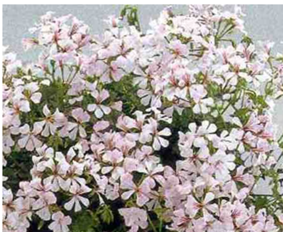
Pelargonium peltatum "Ville de Dresden".

Dit is een donkerbladige hangpelargonium met heel veel witte bloemen, die, naarmate het kouder wordt, iets rozig kleuren. Het is een plant voor de zon tot halfschaduw en ze vraagt ook in het groeiseizoen weinig water. Af en toe voeding maakt de plant mooier. Een viertal planten in een hangpot van 25 centimeter doorsnede wordt een eye-catcher. Deze plant is goed over te houden in de winter. Droog wegzetten en weinig water geven. Vorstvrij is voldoende.