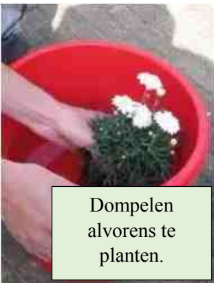
Dompelen alvorens te planten.

plantgat opvult. Een andere naam voor clematis is bosrank en dat houdt in dat de plant graag in de halfschaduw staat, het liefst met het hoofd in de zon en de wortelkluit in de schaduw.