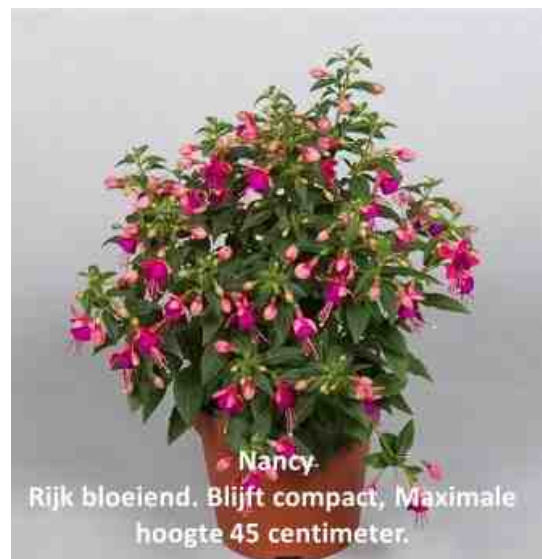
Nancy. Rijk bloeiend. Blijft compact, Maximale hoogte 45 centimeter.

Jollies Nancy is een fuchsia met kleine bloemen. Het is een opgaande groeier, die maximaal 45 centimeter hoog wordt. Bovendien is het een compacte groeier, maar deze draagt heel veel bloemen.