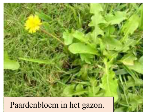
Paardenbloem in het gazon.

Mei is ook de maand dat het gras diverse keren per week gemaaid moet worden, maar na een zachte winter zullen diverse onkruiden tussen de grassprietten tevoorschijn komen. Onkruiden in het gazon kan men niet altijd voorkomen. Wanneer de buurman veel paardenbloemen in zijn tuin heeft, zullen de zaden ook landen in de eigen tuin en zullen zich planten ontwikkelen. Onkruidgroei in het gazon kan men beperken door een goede grondbewerking, een goede bemesting en niet tekort maaien. Heeft men toch onkruiden in het gazon dan kan men op drie manieren proberen de onkruiden kwijt te geraken. (1) Men kan de onkruiden handmatig proberen te verwijderen.