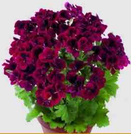
Pelargonium "Candy Flower" Dark Red.

Pelargonium voor niet te grote pot. Lagere temperatuur geeft meer bloei. Kan redelijk droog geteeld worden. Pas op voor botrytis.