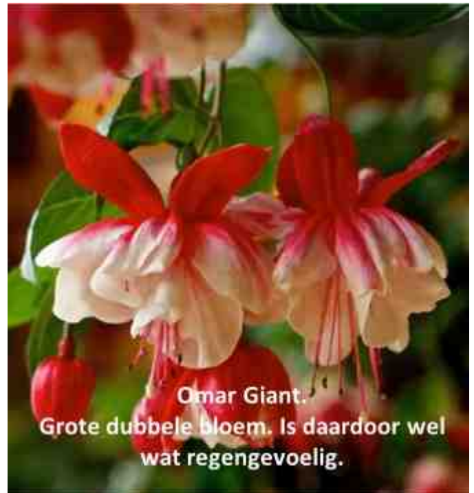
Omar Giant. Grote dubbele bloem. Is daardoor wel wat regengevoelig.

De ervaring van de meeste bezitters is dat het toch een gevoelige plant is.